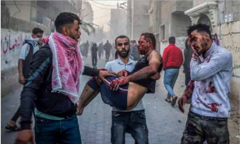
فلسطيني يحمل جريحا أصيب في غارة إسرائيلية على رفح أمس.