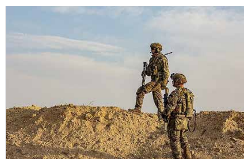
جنديان أميركيان في إحدى القواعد العسكرية في العراق.

ثمانية مقاتلين، بحسب الحصيلة التي كشفت عنها "كتائب حزب الله"، وهي فصيل نافذ في الحشد الشعبي. وهاجمت طائرات مسيرة الأربعة وصباح الخميس "قوات أميركية ومن التحالف" متمركرة في قاعدة عسكرية في مطار أربيل الدولي في إقليم كردستان شمال العراق، بحسب ما أفاد مسؤول عسكري أميركي وكالة الصحافة الفرنسية. وأضاف أن الهجومين لم يتسببا "بسقوط ضحايا أو أضرار بالبنية التحتية". كما أطلقت أمس طائرات مسيرة عدة على القوات الأميركية وقوات التحالف المتمركزة في قاعدة عين الأسد الجوية في الأنبار غرب العراق، دون تسجيل وقوع إصابات أو أضرار، بحسب المسؤول العسكري الأميركي. 10