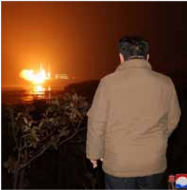
الزعيم الكوري الشمالي كيم جونغ أون يشرف على عملية إطلاق القمر الإصطناعي من مقاطعة فيونغان بشمال البلاد الثلاثاء