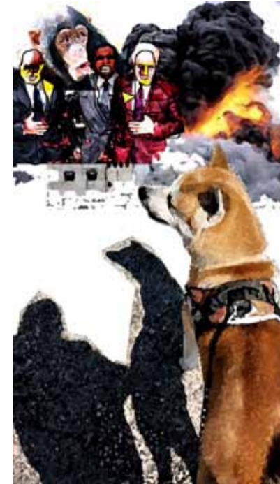
كوبر إن حكى، توفيل شي للرشام منصور الهير.

قال لي السيد cooper، أمس، ونحن نتمشّي في سناثم الخريف: لم يعد مقبولاً أن يُستخدم جنس الكلاب للدلالة على حقارة الجنس البشري. كلما خان أحدهم أحداً، أو نكث، أو انتهر، أو سرق، أو ظلم، أو ارتكب مجزرة، وكلما أصدرت بلادٌ "حزّة" موقفاً مخزياً حيال ما يجري في فلسطين، في لبنان، أو في سواهما، هبّ بعضكم لينعت هؤلاء بأنهم كلاب، تعبيراً عن الاحتقار. قلّ لي، أيّها التابع: أيّ تناقض يقع فيه هذا الإنسان: من جهة يصف الكلب بأنه مخلص، وفيّ، نبيل، حنون، رؤوف، وإلى آخره. من جهة ثانية يستخدم مصطلح الكلبية ليصف بما انتهازية الكائن البشري، ودنائه، وتملّقه، ونذالته، وصفرة، وحقارته، وخيانتته، وبياس الرأفة في قلبه، وعدم أمانته، وإلى آخره.