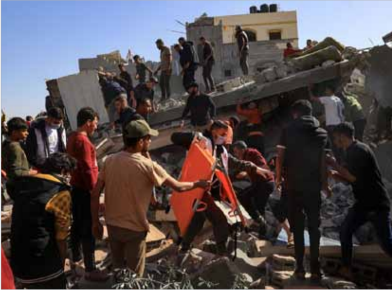
مسعفون فلسطينيون يبطون عن ناجين تحت ركام منزل دمرته غارة إسرائيلية في مدينة رفح بجنوب قطاع غزة أمس.

وتواصل القتال طوال الليل في قطاع غزة. وأوردت وكالة "وفا" الفلسطينية للأنباء