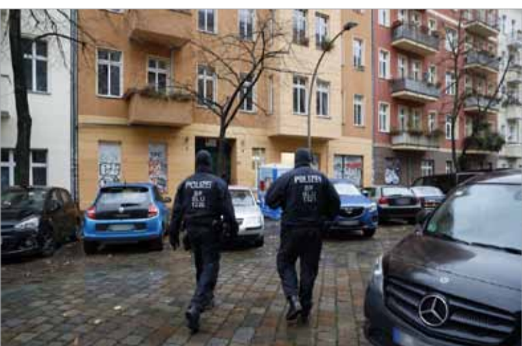
شريطان أمام مبنى في برلين خلال مداهمات نفذتها السلطات الألمانية لما قالت أنهم عناصر من "حماس" و"صامدون" أمس.

شنت وزارة الداخلية الألمانية حملة تفتيش ومداهمات صباح أمس في بعض المدن الألمانية، قالت إنها تستهدف عناصر من حركتي المقاومة الإسلامية "حماس" وشبكة "صامدون للدفاع عن الأسرى" المؤيدة للفلسطينيين، المحظورتين في البلاد، والمتعاطفين معهما وفق بيان للوزارة. 10